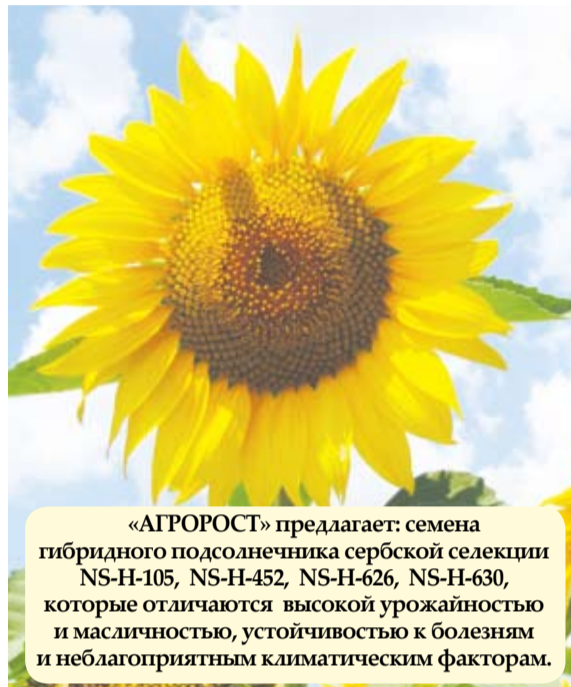
«АГРОРОСТ» предлагает: семена гибридного подсолнечника сербской селекции NS-H-105, NS-H-452, NS-H-626, NS-H-630, которые отличаются высокой урожайностью и маслячностью, устойчивостью к болезням и неблагоприятным климатическим факторам.

В планах компании – заняться повышением агрономических знаний своих клиентов, создать своеобразную «бизнес-школу для фермеров». Приглашенные ученые будут рассказывать аграриям о современных технологиях выращивания сельхозкультур, новинках агропромышленности, тенденциях его развития.