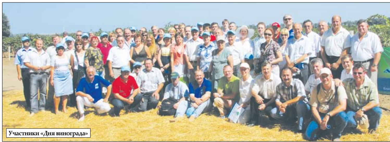
Участники «Дня винограда»

Стоимость системы в рекомендованных ценах на 2008 г. составила 9493 руб.