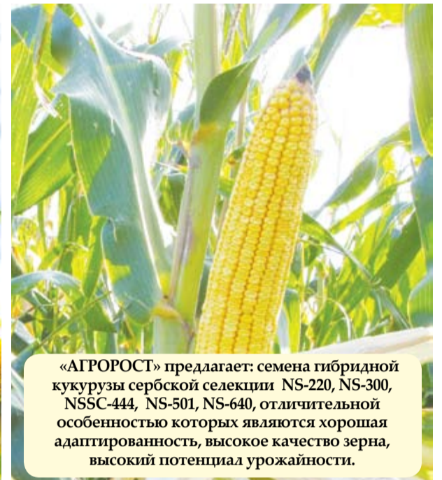
«АГРОРОСТ» предлагает: семена гибридной кукурузы сербской селекции NS-220, NS-300, NSSC-444, NS-501, NS-640, отличительной особенностью которых являются хорошая адаптированность, высокое качество зерна, высокий потенциал урожайности.

Гибкие условия реализации: частичный либо полный товарный кредит, 100%-ная предоплата.