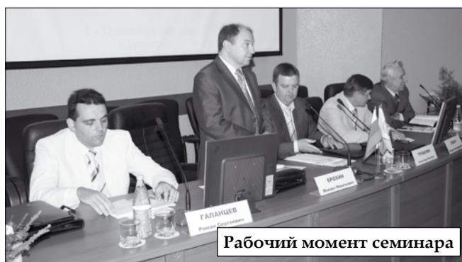
Рабочий момент семинара