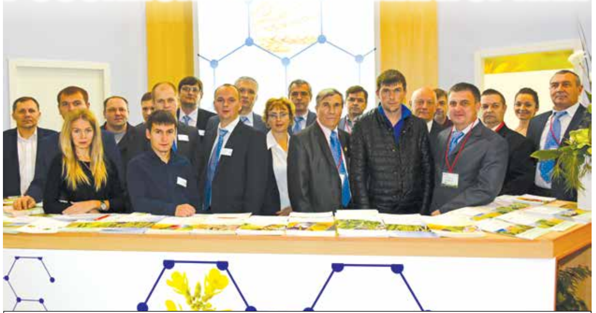
Сотрудники компании «Агро Эксперт Групп», ставшей спонсором деловой программы «ЮГАГРО-2015», на выставочном стенде

проблем при защите сельхозкультур. В подтверждение своих слов специалист дала краткую характеристику основным препаратам.