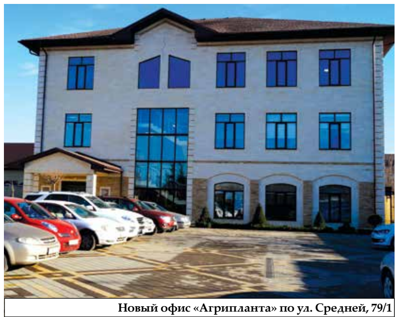
Новый офис «Агрипланта» по ул. Средней, 79/1