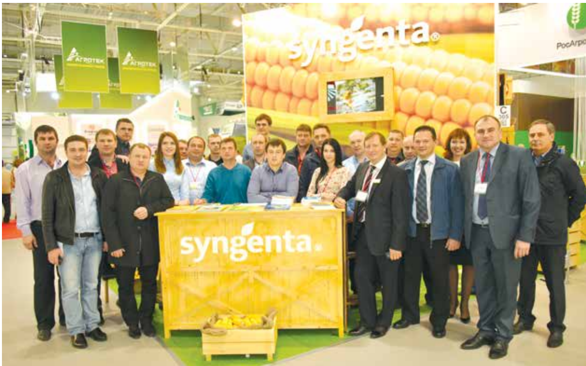
Для компании «Сингента», как и для других фирм-производителей, выставка «ЮГАГРО» - своеобразная площадка для встреч с партнёрами, подведения итогов и составления планов на будущее

Нестабильность курса рубля, внешние экономические и политические события 2015 года оказали значительное влияние и на отрасль АПК. В частности, многих аграриев по-прежнему волнует ситуация на рынке средств защиты и семян, ведь цены продолжают ползти вверх.