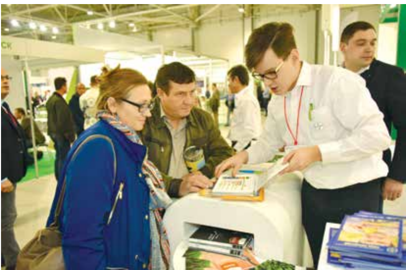
Каждому посетителю стенда – максимум внимания