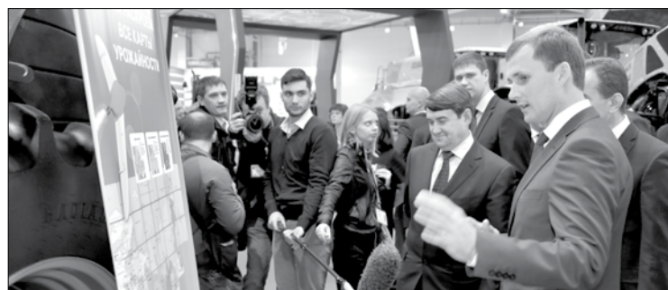
Министр сельского хозяйства и перерабатывающей промышленности Краснодарского края А. Н. Коробка (на переднем плане) представляет дрон помощнику Президента РФ И. Е. Левитину и губернатору Кубани В. И. Кондратьеву