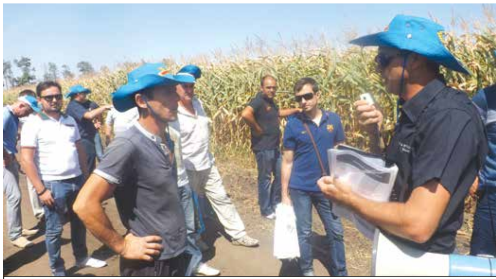
Совместные дни поля компаний «Агриплант» и «Монсанто» становятся традицией