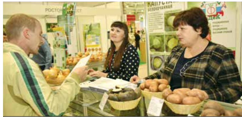
На стенде компании всегда было многолюдно

просто ажиотажный, хотя они не совсем привычны для нашего рынка: длинные, до 40 см, с тонкой кожицей, сладкие, плодоносят, если брать по Краснодарскому краю, практически до ноября в открытом грунте.