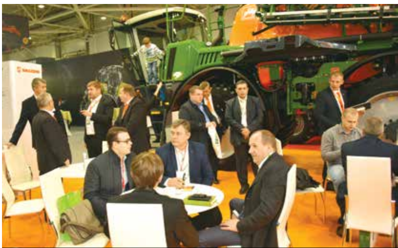
Рабочие встречи на «ЮГАГРО-2015»