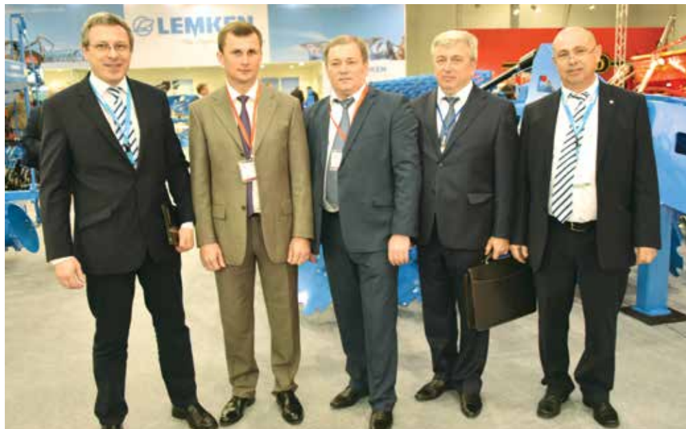
Руководство Lemken в России встречает на своем стенде делегацию VIP-гостей