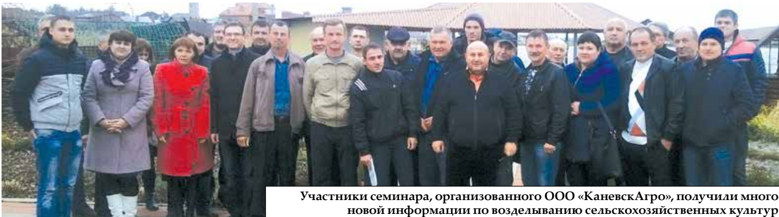
Участники семинара, организованного ООО «Каневск-Агро», получили много новой информации по возделыванию сельскохозяйственных культур

ст. Натухаевская, ул. Раевского (промзона), тел.: 8 (86117) 300-233, 8 (988) 670-32-73