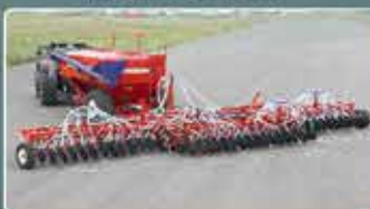
Дисковые посевные комплексы AGRATOR DISK