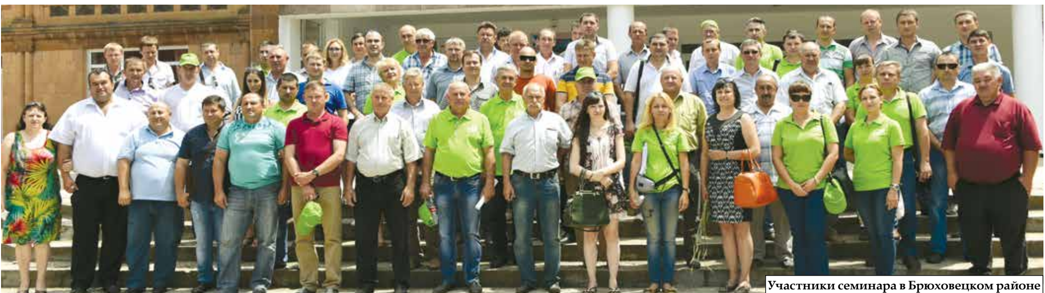
Участники семинара в Брюховецком районе