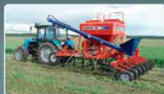
Средние посевные комплексы AGRATOR