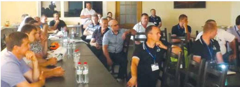
На пленарной части «дня поля»

- В своём хозяйстве я пока не применял СЗР от «Агро Эксперт Групп», но представленные на «дне поля» результаты убедили меня в том, что эта российская компания производит качественные и эффективные в наших условиях препараты. Особо хочу отметить новинку - фунгицид Флинт, ВСК. Очень интересный препарат. Думаю, в следующем году я применю его на своих посевах.