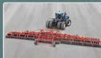
Широкозахватный дисковый агрегат MEGADISK