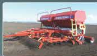
Комбинированные посевные комплексы AGRATOR COMBIDISK