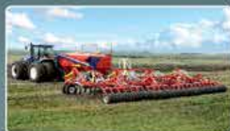
Широкозахватные посевные комплексы AGRATOR