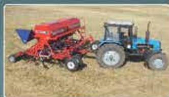
Механические посевные комплексы AGRATOR M