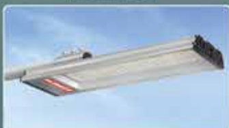
Светодиодные светильники GELIOMASTER