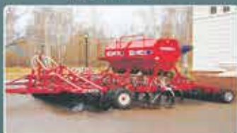
Дискокультиваторные посевные комплексы AGRATOR DK