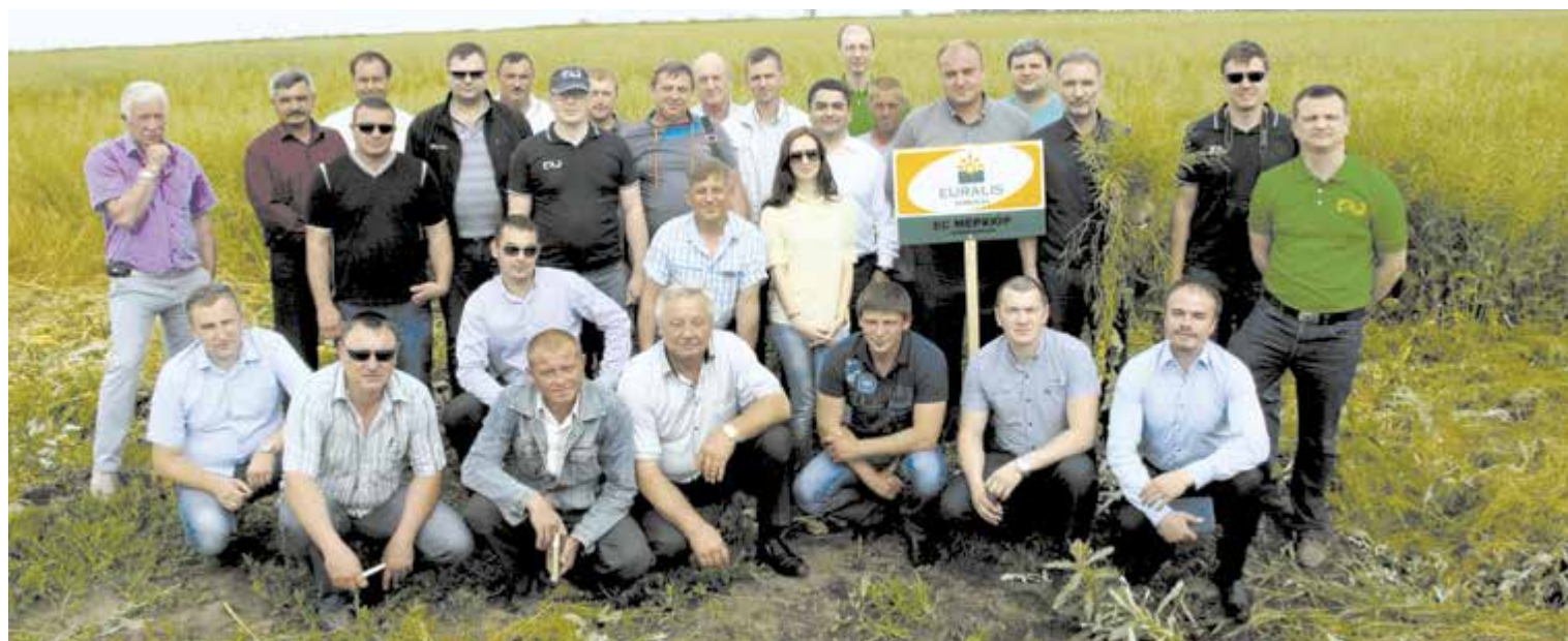
Сотрудники ООО «Агробизнес-Консалтинг» совместно с партнерами на одном из мероприятий

В рамках одной статьи практически невозможно рассказать обо всех современных технологиях возделывания риса. Для получения консультаций и приобретения препаратов обращайтесь в ООО «Агробизнес-Консалтинг»