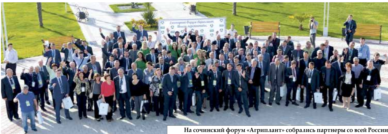
На сочинский форум «Агриплант» собрались партнеры со всей России