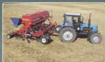
Механические посевные комплексы AGRATOR M