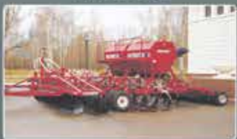
Дискокультиваторные посевные комплексы AGRATOR DK