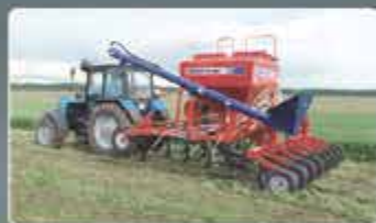
Средние посевные комплексы AGRATOR