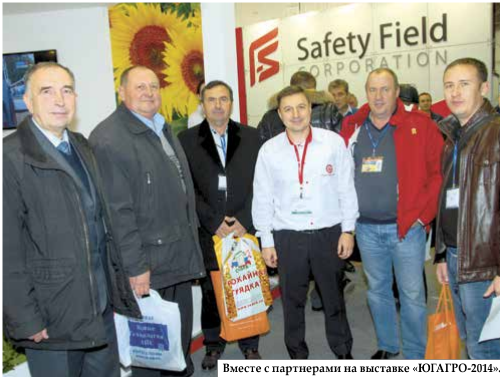
Вместе с партнерами на выставке «ЮГАГРО-2014».

В целом объёмы наших продаж в России по итогам сезона-2014 увеличились как по кукурузе, так и по подсолнечнику. Положительная динамика продаж говорит о том, что аграрии доверяют нашим гибридам, убедившись в их высоком генетическом потенциале. Это подтолкнуло компанию Limagrain к расширению