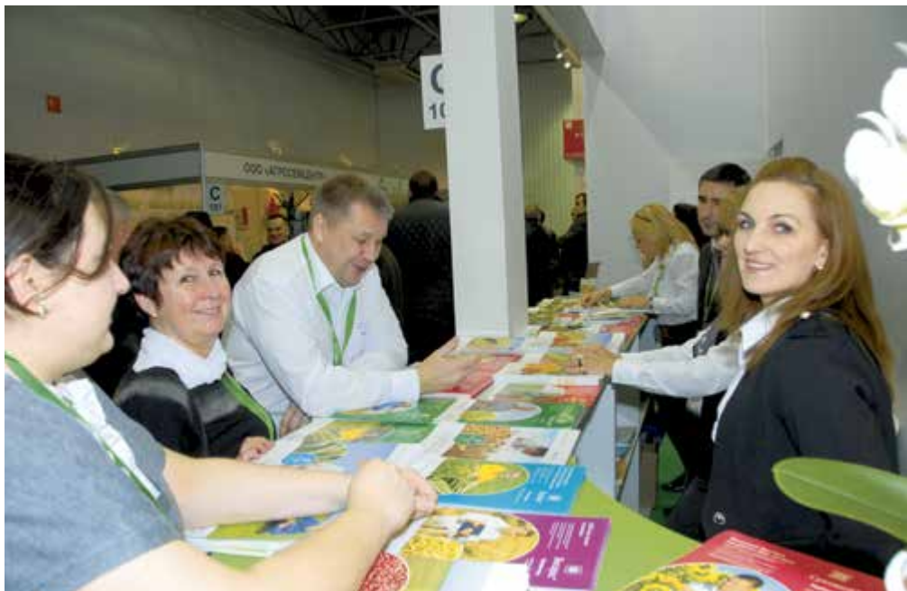
Переговоры с партнерами, общение с клиентами - важнейшие моменты выставки «ЮГАГРО-2014»

Фунгицид Спирит, СК (эпоксиконазол, 160 г/л, и азоксистробин, 240 г/л) отличается тем, что имеет в своем составе азоксистробин. Это самый популярный в мире фунгицид. Он относится к химическому классу стробилуринов и кроме фунгицидных свойств отличается ярко выраженным физиологическим действием, что на высоких агрофонах даже при отсутствии заболеваний формирует более высокий урожай.