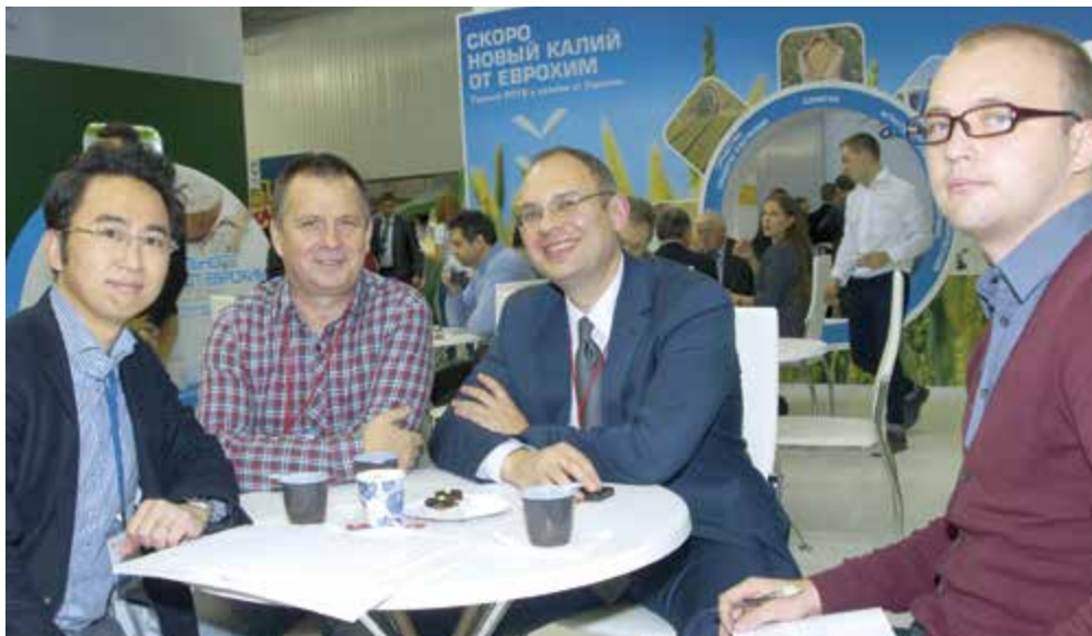
Деловые встречи на «ЮГАГРО» помогают компании «Еврохим» выбрать верный вектор развития

Участником 21-й Международной агропромышленной выставки «ЮГАГРО-2014» традиционно была компания «Еврохим», хорошо известная аграриям юга России как крупнейший производитель и поставщик качественных минеральных удобрений, средств защиты растений, а также сопутствующих товаров и услуг. МХК «Еврохим» стремится максимально эффективно удовлетворить спрос потребителей своей продукции, чтобы их бизнес был максимально прибыльным и доходным.