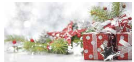
Р. ЛИТВИНЕНКО