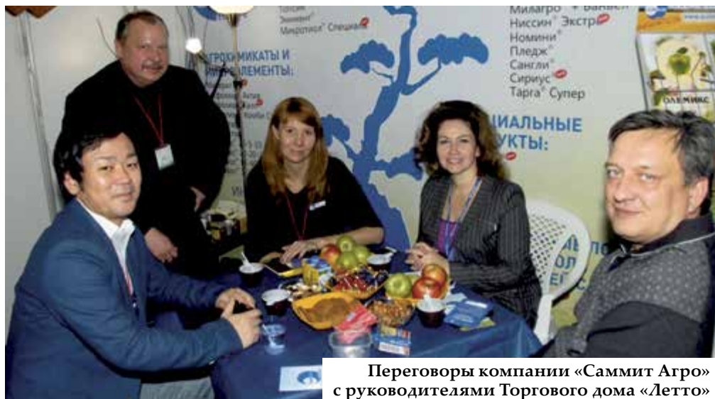
Переговоры компании «Саммит Агро» с руководителями Торгового дома «Летто»

Особое внимание мы уделили проекту по внедрению припосевных удобрений Микростар. Пожалуй, для России это совершенно новый опыт. Мы предлагаем использовать технологию