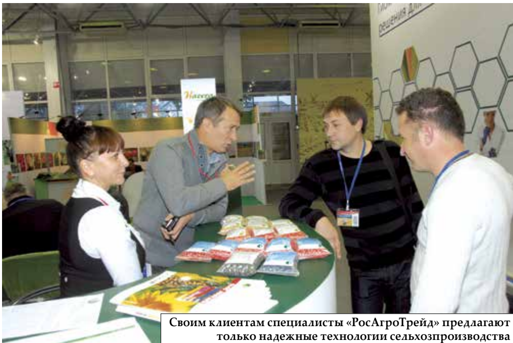
Своим клиентам специалисты «РосАгроТрейд» предлагают только надежные технологии сельхозпроизводства

РАЖТ обладает базой данных под названием Система Оценки Видов (COV), в которую занесены наблюдения и результаты тестов, проведенных с различными видами культур, в том числе на территории юга России. Эти