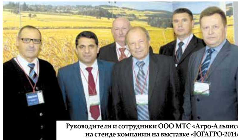
Руководители и сотрудники ООО МТС «Агро-Альянс» на стенде компании на выставке «ЮГАГРО-2014»

Дополнительное преимущество препаратам и семенам от «Агро-Альянс» даёт их испытание на собственных полях в ООО «Луч» (с. Вишневка Верхнехавского района Воронежской области), где на 3000 га выращиваются озимая и яровая пшеница, сахарная свекла, ячмень, кукуруза, подсолнеч-