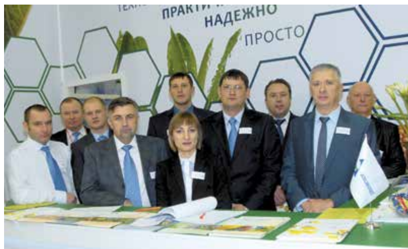
Команда профессионалов ООО «Агро Эксперт Групп» на выставке «ЮГАГРО-2014»

Специалисты компании «Агро Эксперт Групп» надеются, что созданные ими новые высокотехнологичные препараты позволят сельскохозяйственным производителям выйти на качественно новый уровень защиты растений от вредных организмов. Со своей стороны компания гарантирует всестороннюю поддержку тем производителям, которые будут реализовывать эти решения в своей практической деятельности.