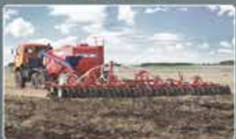
Автомобильные посевные комплексы AGRATOR AUTO