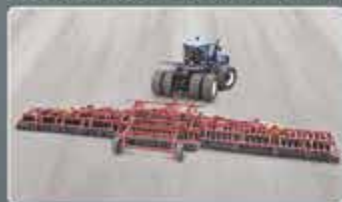
Широкозахватный дисковый агрегат MEGADISK