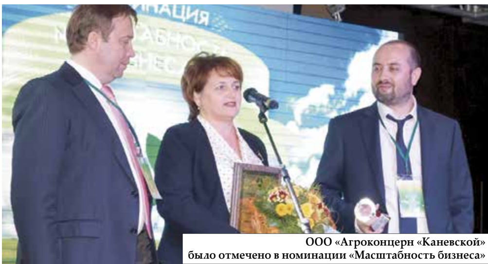
ООО «Агроконцерн «Каневской» было отмечено в номинации «Масштабность бизнеса»

Напротив, ООО «Агриплант Дон» - самое старое: образовано в 2007 году и имеет большой опыт работы на рынке. Не случайно среди его клиентов более 100 коллективных и фермерских хозяйств. Соответственно и специализация филиала более обширная. Сотрудники предприятия оказывают услуги по возделыванию зерновых колосовых, кукурузы, подсолнечника, гречихи, проса, риса, рапса и других культур.