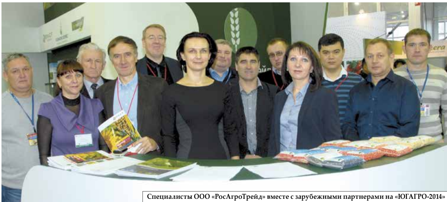
Специалисты ООО «РосАгроТрейд» вместе с зарубежными партнерами на «ЮГАГРО-2014»

Руководство и специалисты компании «РосАгроТрейд» нацелены на то, чтобы помочь агрономам эффективно использовать весь биологический потенциал культурных растений за счёт применения современных технологий и высокопродуктивных гибридов. Принято решение в качестве основных поставщиков семян и селекционных достижений ориентироваться на французские компании РАЖТ и «Флоримон Депре», так как они отлично зарекомендовали себя на европейском рынке, где гибриды этих компаний показывают высокие результаты уже не одно десятилетие. На сегодняшний день «РосАгроТрейд» является эксклюзивным импортёром семян этих производителей. Демонстрационные испытания и производственное использование в России этих французских гибридов подтвердило правильность сделанного выбора.