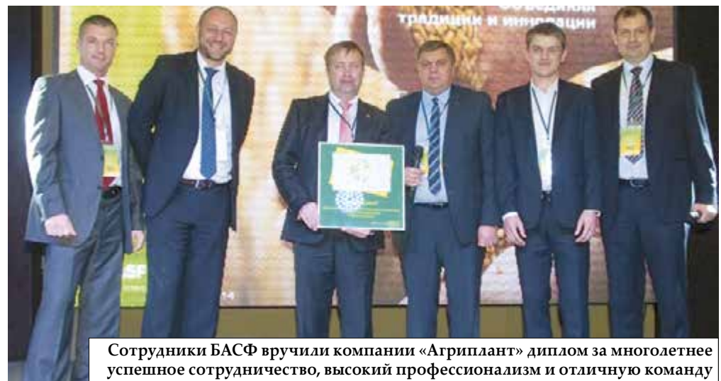
Сотрудники БАСФ вручили компании «Агриплант» диплом за многолетнее успешное сотрудничество, высокий профессионализм и отличную команду

закладывали опыты, где подбирались лучшие сорта и гибриды, наиболее эффективные пестициды для технологий возделывания сельскохозяйственных культур. Специалисты компании первыми среди других фирм начали проводить фитоэкспертизу семян зерновых культур. Другими словами, они всегда старались быть на шаг впереди.