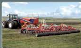
Широкозахватные посевные комплексы AGRATOR