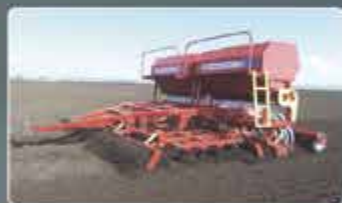
Комбинированные посевные комплексы AGRATOR COMBIDISK