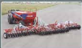
Дисковые посевные комплексы AGRATOR DISK