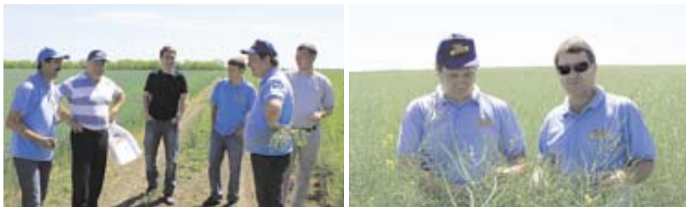
Промежуточный обезд посевов озимого рапса ДК Секюр сотрудниками «Монсанто»

СПК колхоз «Родина», ЗАО «Нива» (Новоалександровский район), ООО «Победа», ГСУ «Красногвардейский» (Красногвардейский район).