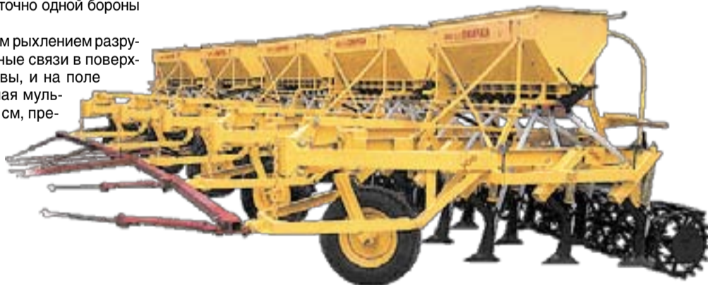
Технические характеристики модульных посевных комплексов КСКП «Омич»