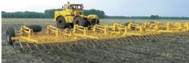
Технические характеристики тяжелой бороны БСП-21 «Бригантина»

В производстве сельхозмашин сохраняется тенденция повышения их функциональности и производительности. Для крупных хозяйств важно, чтобы они работали четко и без сбоев, так как оперативно следить за качеством работы на каждом гектаре просто невозможно.